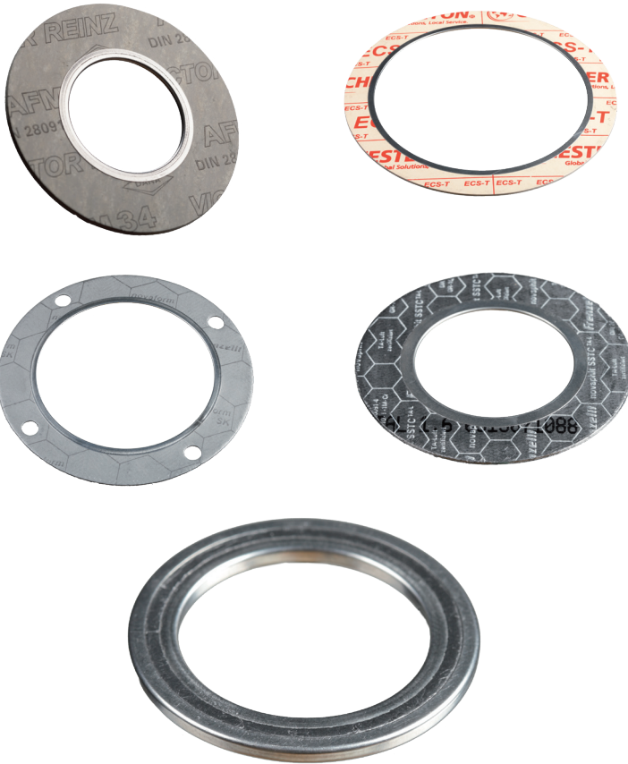
Grafit-Dichtung mit Innen- und Außenbördel

Die Kombination von Dichtungs- und Bördelmaterialien wird individuell nach Kundenvorgabe konfektioniert.