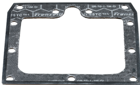
Jede Dichtungsform kann mit einem Bördel versehen werden.