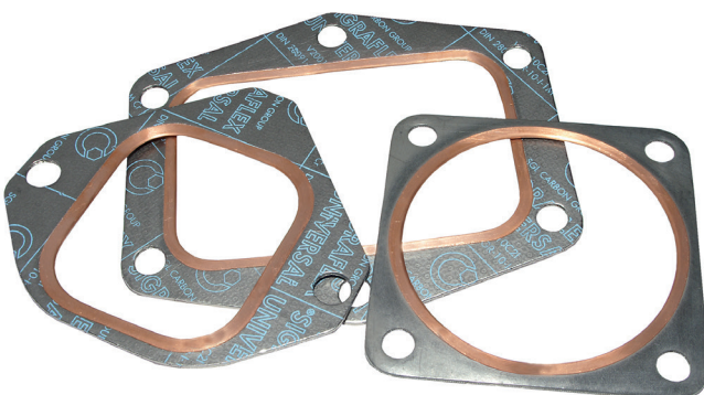
Flachdichtungen mit Kupferbördel